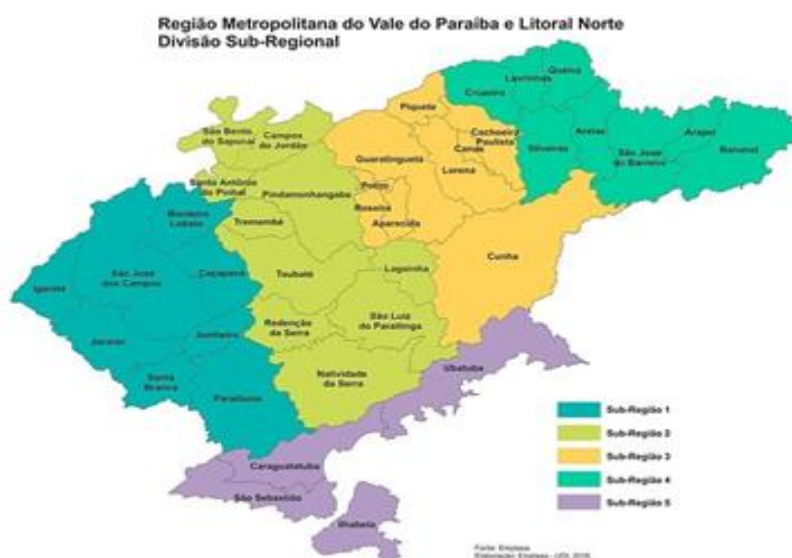
Figura 1. Divisão Sub-Regional da RMVale.